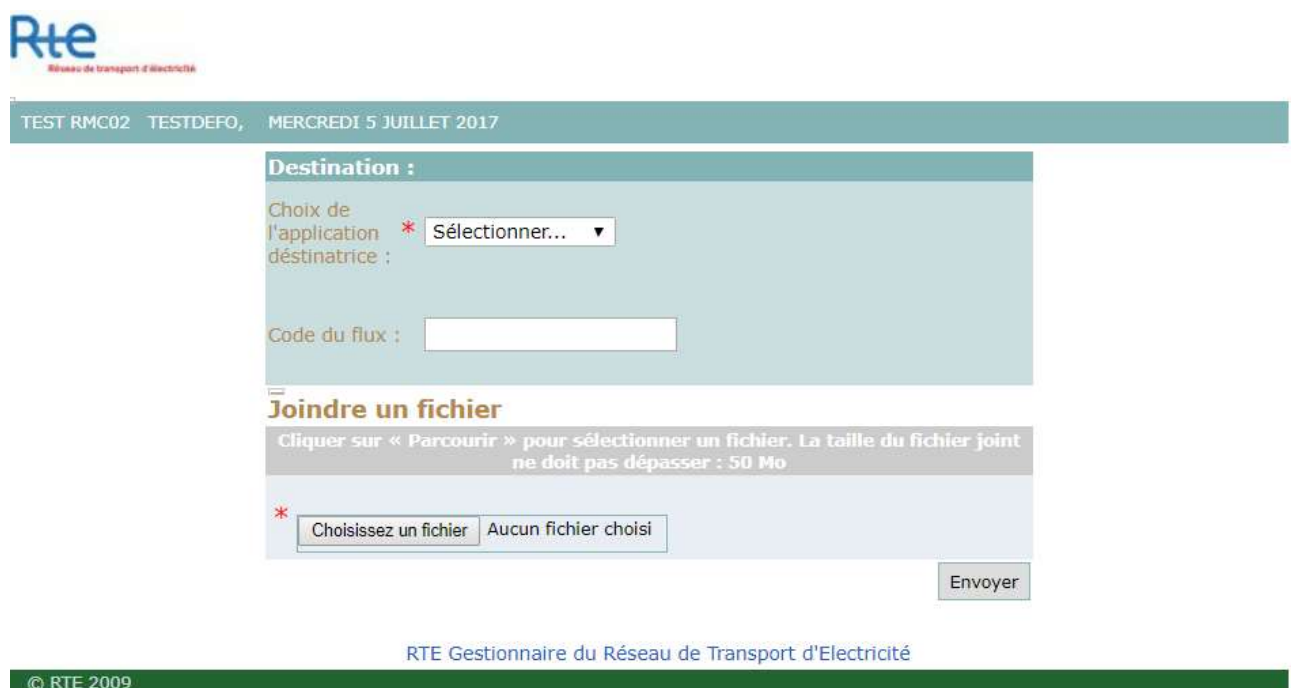
Figure 1 : Maquette de l'écran « Envoi de fichiers à une application de RTE »